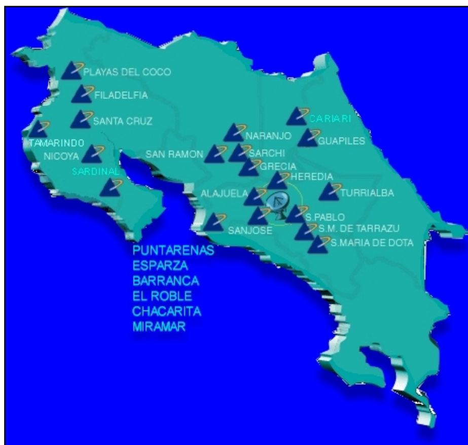
Gráfica 1: Cobertura de la Televisión por cable de Amnet